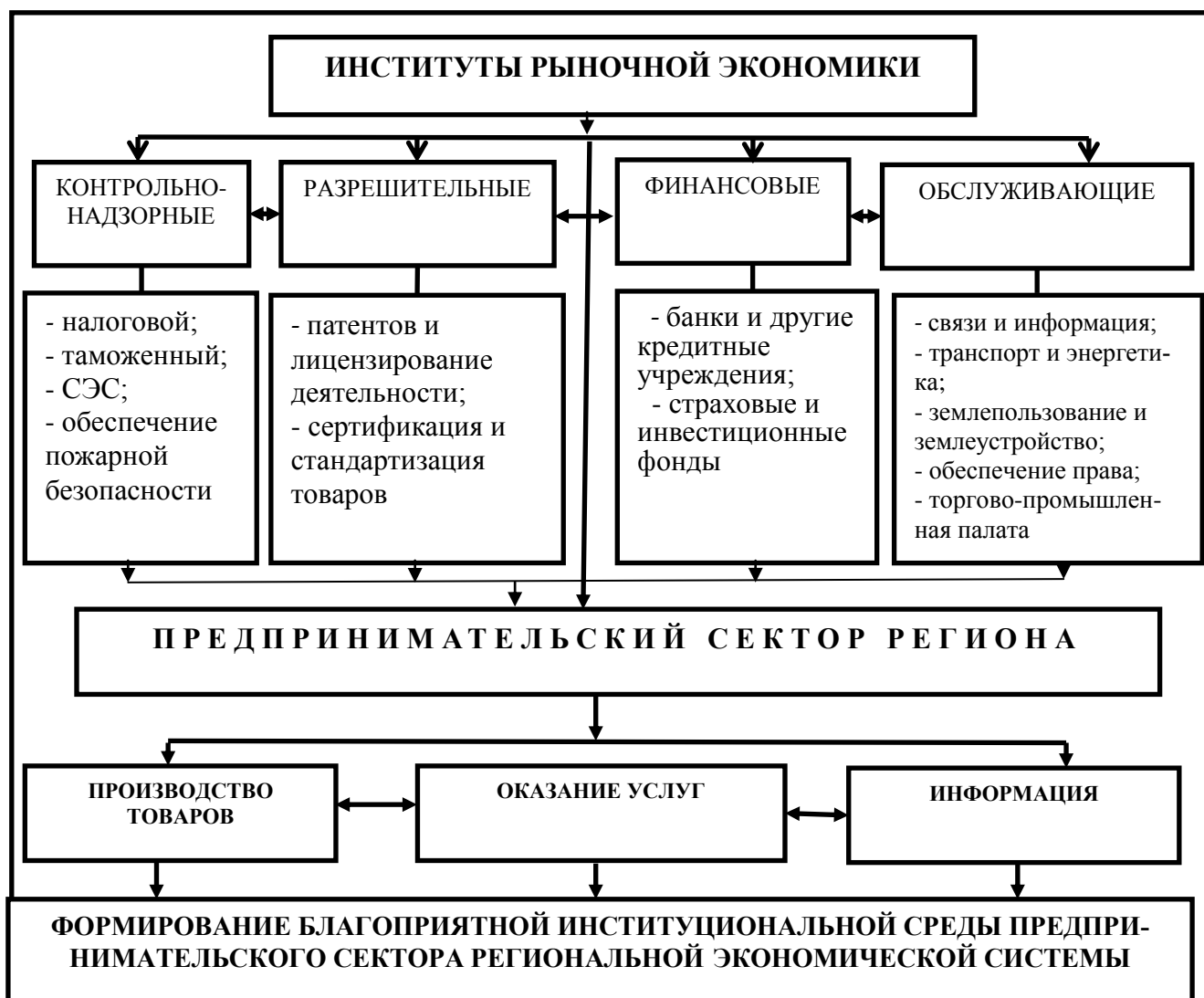
Рис. 2. Функциональная структура институтов развития предпринимательского сектора региона

При этом нужно исходить из того, что предпринимательский сектор и деятельность его субъектов имеет ярко выраженную региональную ориентацию, ибо эффективность функционирования субъектов предпринимательского сектора региона во многом завесит от действия институтов налогового, таможенного, связи и информационных технологий, энергообеспечения, пожарной безопасности, юстиции (в лице нотариуса), обеспечения прав собственности, санитарно-эпидемиологической службы и др.