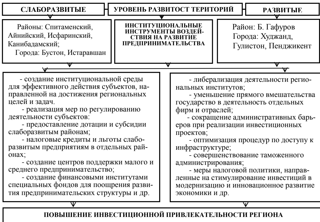
Рис. 4. Институциональные инструменты повышения привлекательности региона

зволяет создать экономическую зону с благоприятными условиями институциональной среды для осуществления активной инвестиционной деятельности на основе предоставления таможенных, налоговых и других льгот.