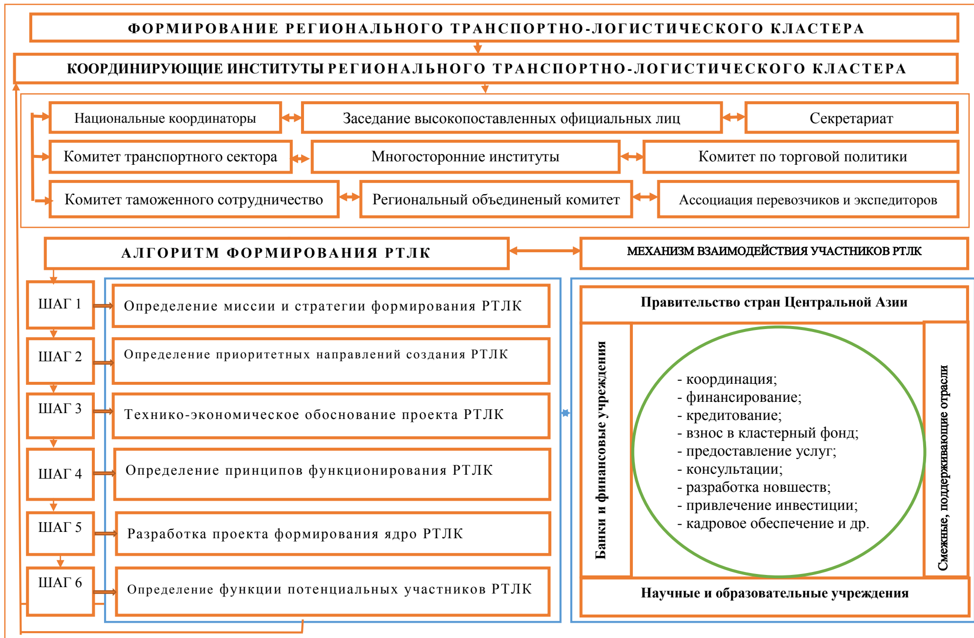
Рис. 3. Модель формирования регионального транспортно-логистического кластера в Центральной Азии