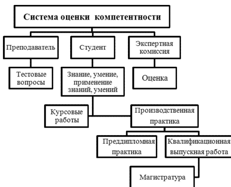
Рис. 1. Модель формирования профессиональной компетентности студента-бакалавра

Система оценки знаний, умений, навыков, профессиональных особенностей и функций экономиста-менеджера позволили составить модель формирования профессиональной компетентности: