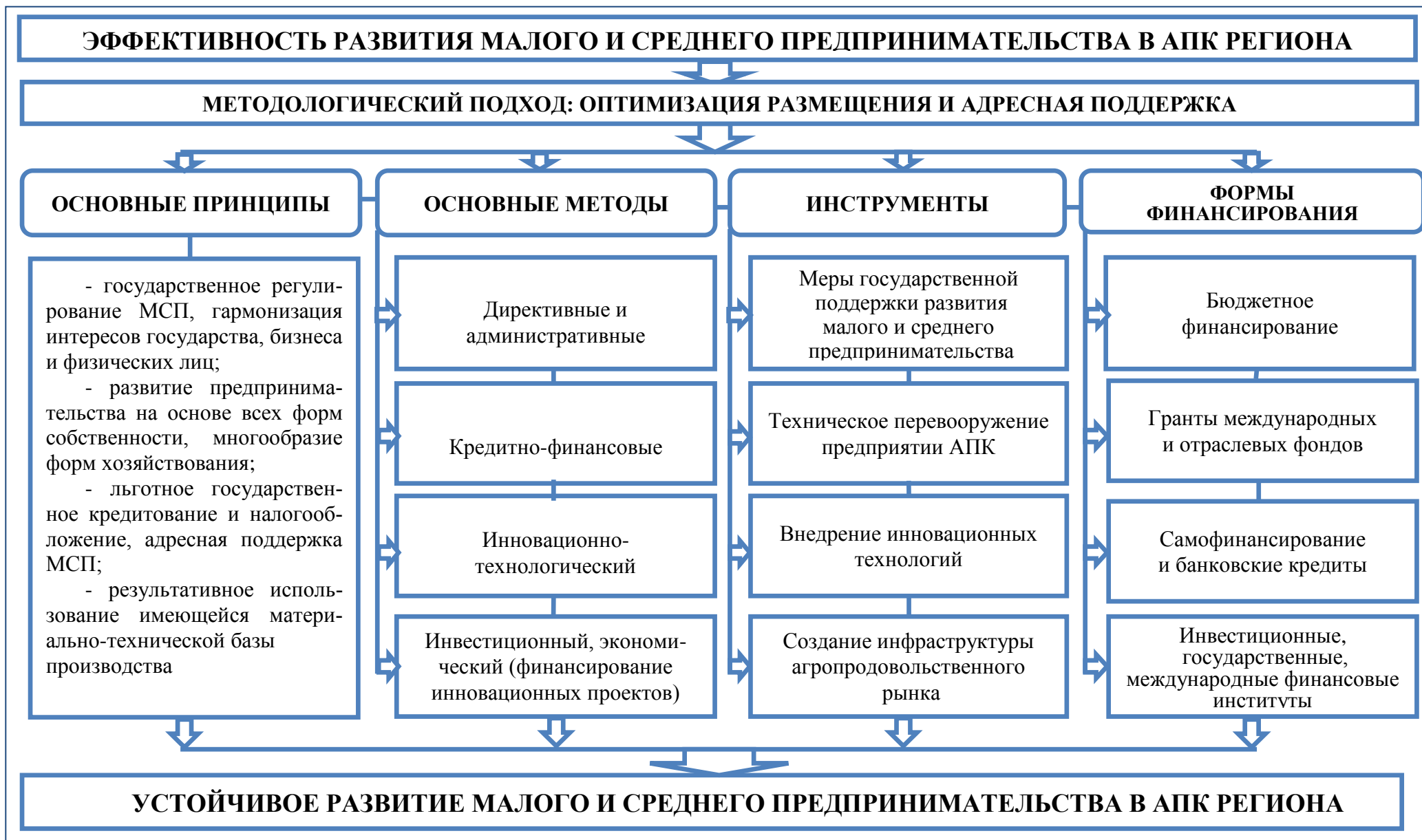
Рис.2. Концептуальный подход к развитию малого и среднего предпринимательства в АПК региона