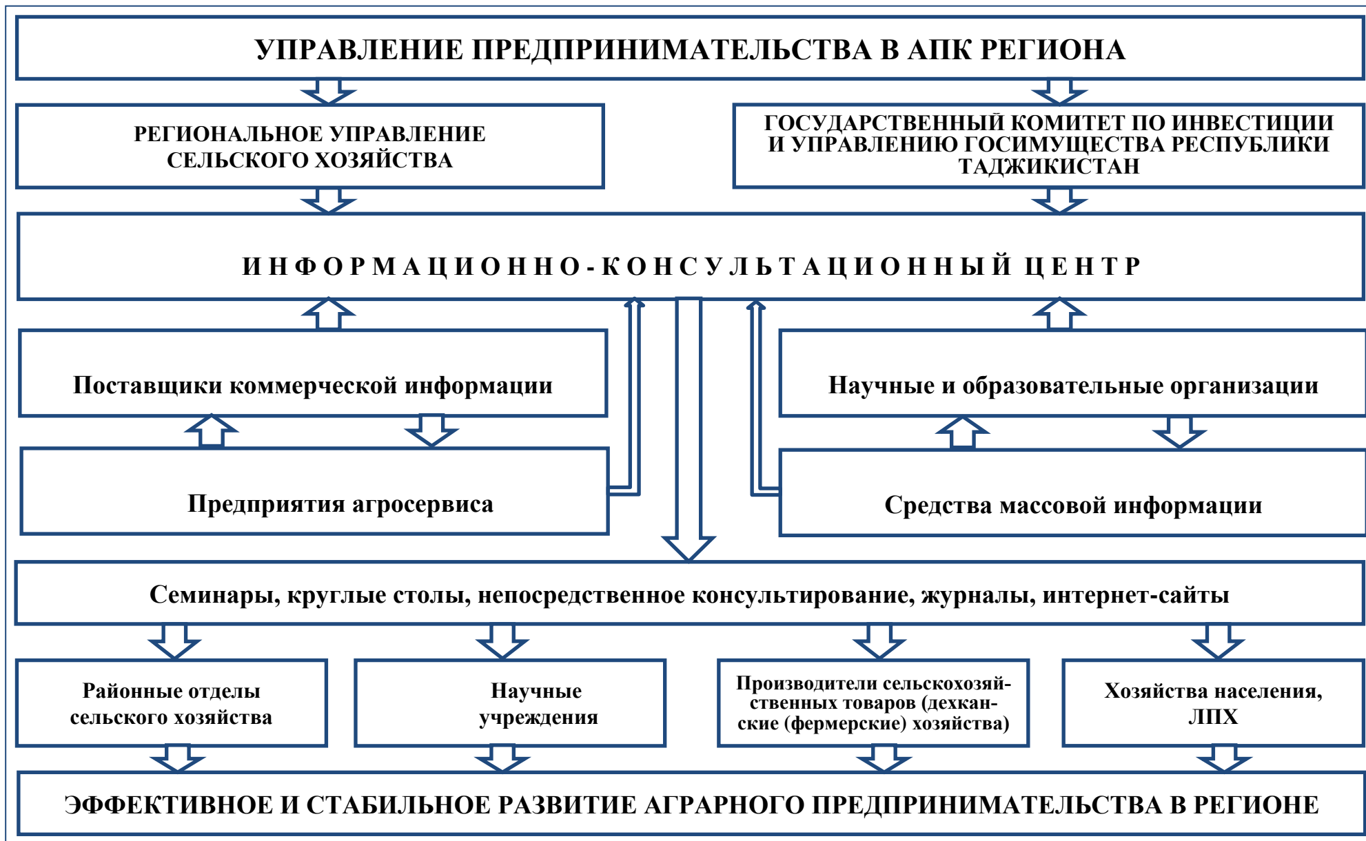
Рис.1. Структурная схема управления предпринимательской деятельности в АПК региона