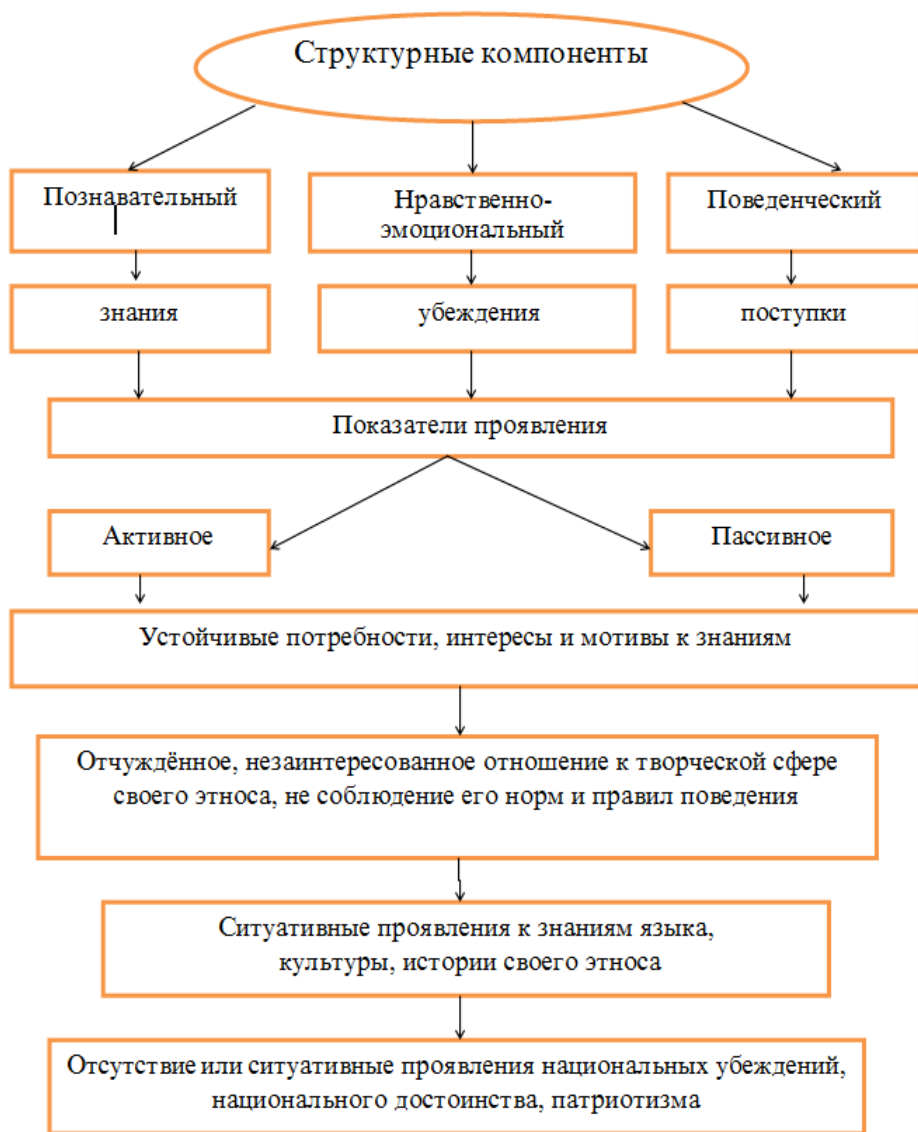
Рисунок 1. Структура национального самосознания личности