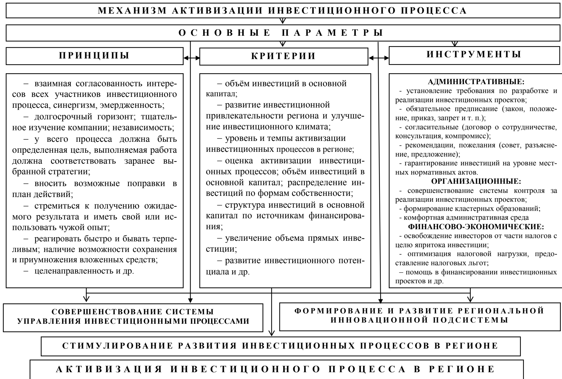
Рис. 2. Концептуальная модель активизации инвестиционного процесса в регионе