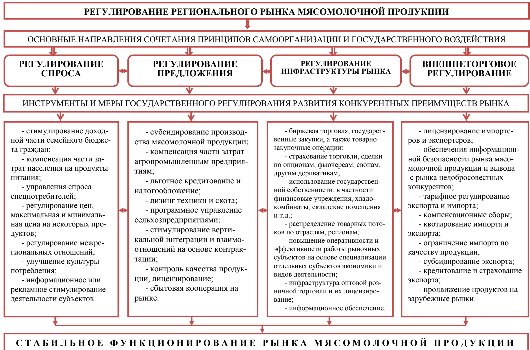
Рис. 2. Основные направления регулирования регионального рынка мясомолочной продукции