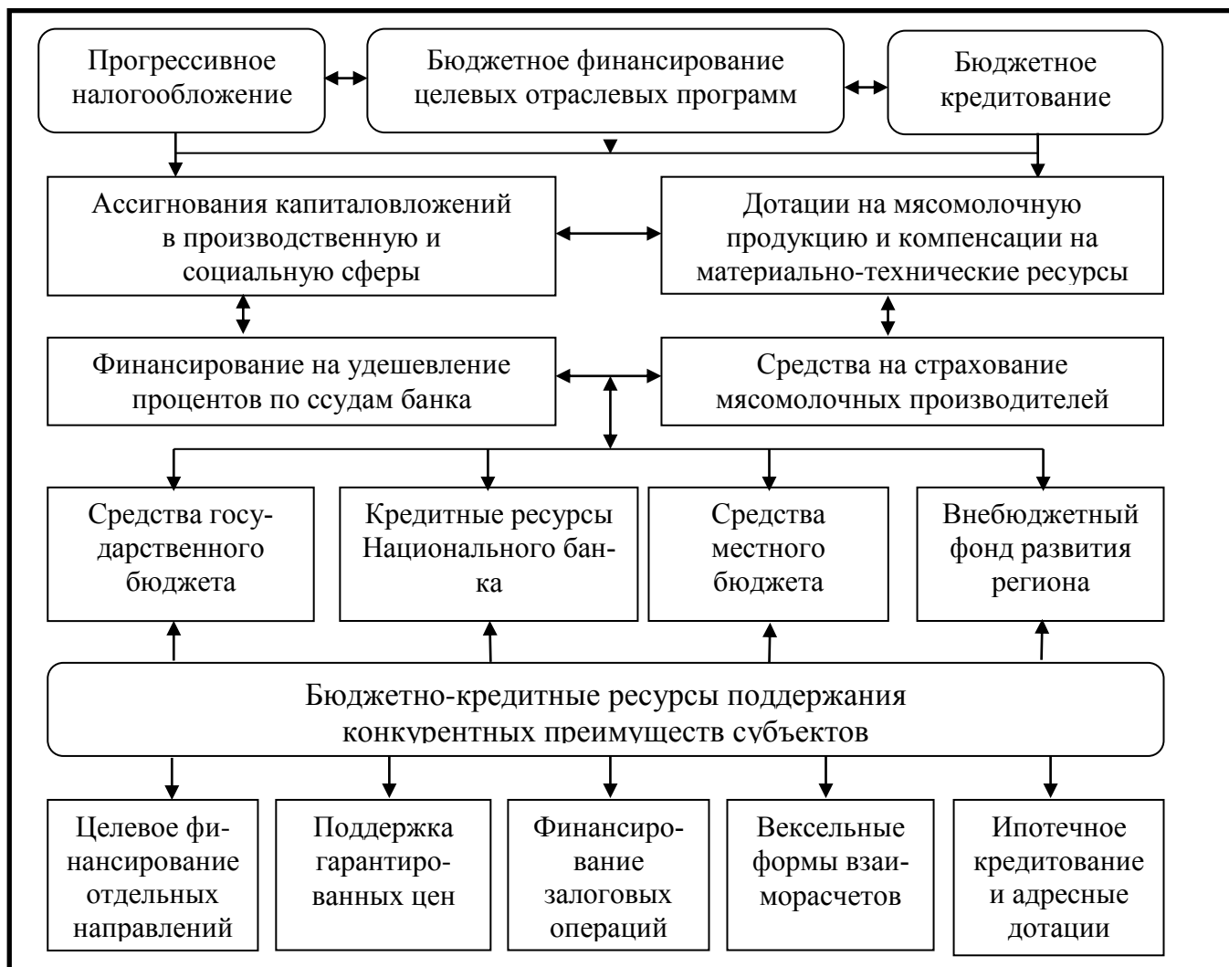
Рис.4. Система прогрессивно возрастающей ставки финансирования субъектов мясомолочного рынка

этом, субсидии и дотации для производителей мясомолочной продукции должны быть основаны на прогрессивно-возрастающих ставках, размер которых зависит от результатов их финансово-хозяйственной деятельности за прошедшие периоды с учетом объема реализации продукции и уровнем продуктивности.