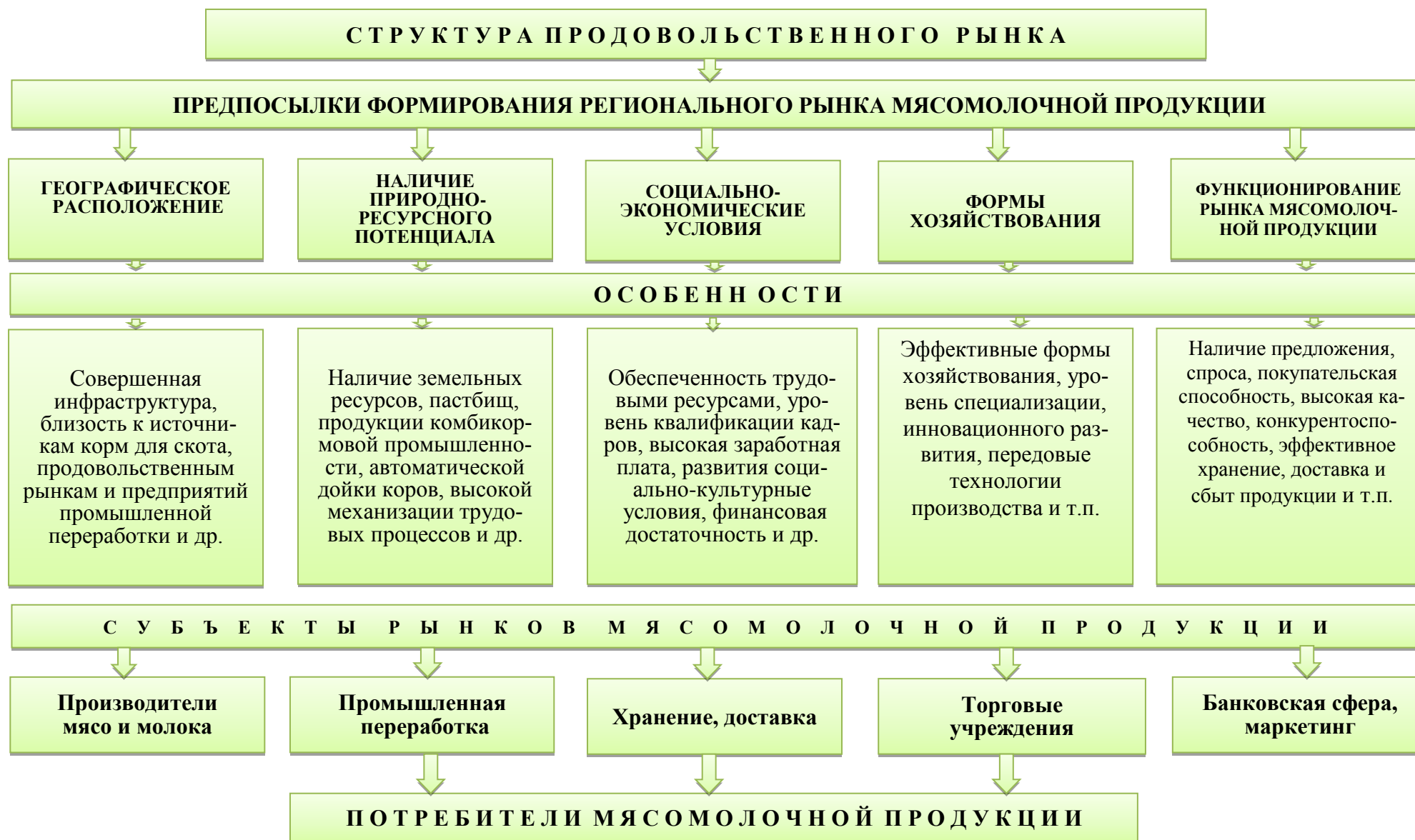
Рис.1. Структура регионального мясомолочного рынка